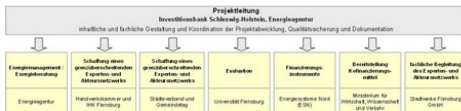
Struktur des EnerKo-Projekts